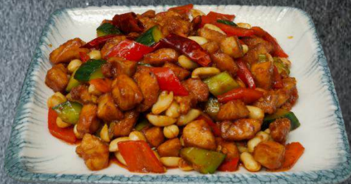
40. Tochu Meghiz Kormasi 15,99 im Wok gebratenes, Erdnuss, Hähnchenfleisch ohne Knochen mit Frühlingszwiebeln. Beilage Reis