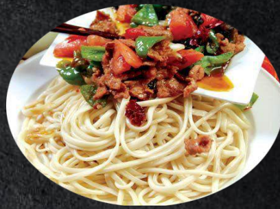
31. Güro-Laghmen 14,99 gekochte Nudeln, Rindfleisch, Zwiebeln, schwarze Pilze, rote und grüne Paprika(A,C,L)