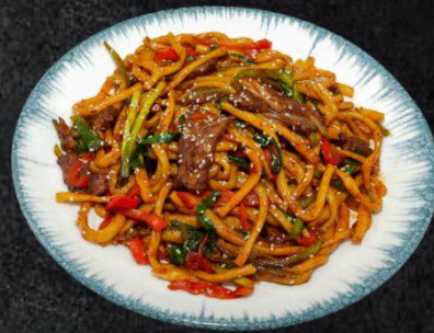
33. Korulghan-Laghmen 14,99 im Wok gebratene Nudeln, Rindfleisch, Zwiebeln, rote und grüne Paprika(A,C,N)