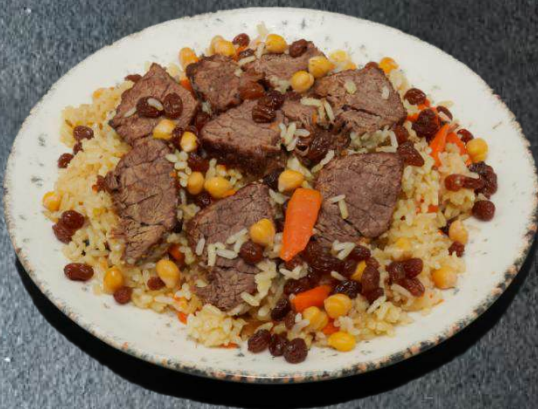
22. Uigur Polo 14,99 Rindfleisch, Reis, Karotten, Rosinen und Kichererbsen Dieses Gericht gibt es nur Fr., Sa. und So.