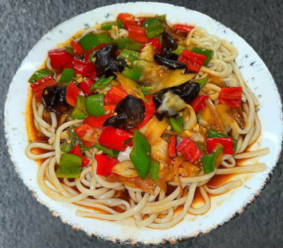
60. Guro-Laghmen Veggi 13,99 gekochte Nudeln, Zwiebeln, schwarze Pilze, rote und grüne Paprika(A,C,L)