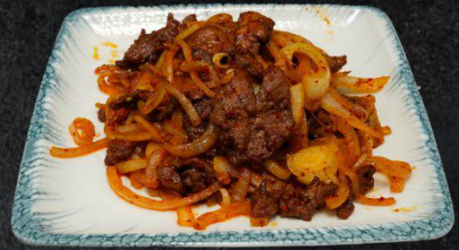
37. Uigur Kazan Kawap 22,50 Uigurisch gewürztes Rindfleisch und Zwiebeln Beilage Reis