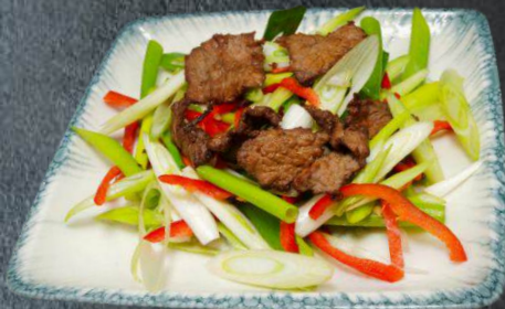
38. Songpjas 19,99 im Wok gebratenes Rindfleisch mit Frühlingszwiebeln Beilage Reis