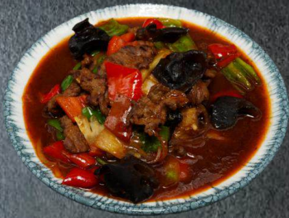
36. Iz Alahide Kormasi 22,50 Rindfleisch, rote und grüne Paprika, Frühlingszwiebeln, Zwiebeln. Beilage Reis