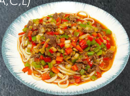
32. Süro-Laghmen 14,99 gekochte Nudeln, Rindfleisch, Zwiebeln, rote und grüne Paprika (A,C,L)