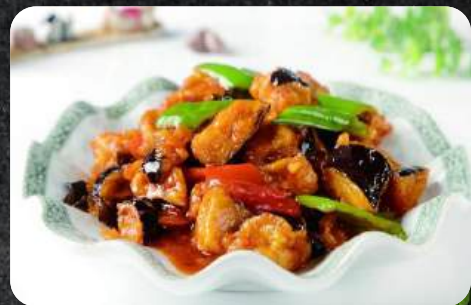
65. Pidigen Kormasi 15,99 Aubergine, Tomaten, rote und grüne Paprika. Beilage Reis