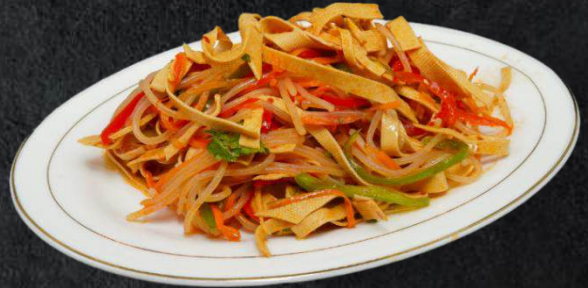
2. Arlasch Salat 6,99 mit Tofu Nudeln, Karotten, rote und grüne Peperoni