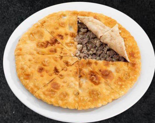
23. Gösch Nan 14,90 Rindfleisch, Zwiebeln, spezielle Gewürze..