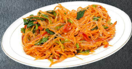
1. Uigur Salat 6,99 Glasnudel mit Karotten, rote und grüne Peperoni (F)