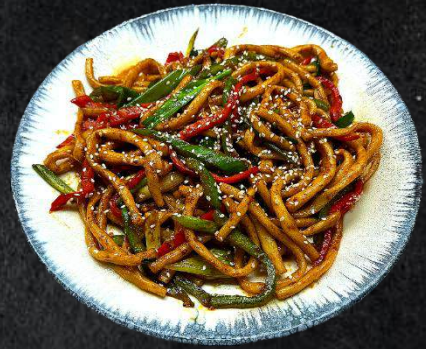
61. Korulghan-Laghmen Veggi 13,99 im Wok gebratene Nudeln, Zwiebeln, rote und grüne Paprika (A,C,N)