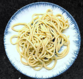
4. Polo/Laghmen 3,00 Reisbeilage/Nudelbeilage