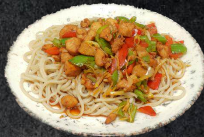
35. Tochu Laghmen 13,99 Gekochte Nudeln, Marinierte Hänchen, Frühlingszwiebeln, rote und grüne Paprika(A,C)