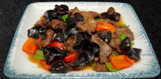
39. Mor Kormasi 19,99 Rindfleisch, schwarze Pilze, rote und grüne Paprika. Beilage Reis