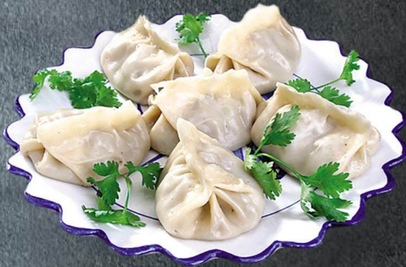
20. Manta 14,99 mit Hackfleisch gefüllte Teigtaschen, dazu Pikante Chilisoße und Sojasoße (A,C)