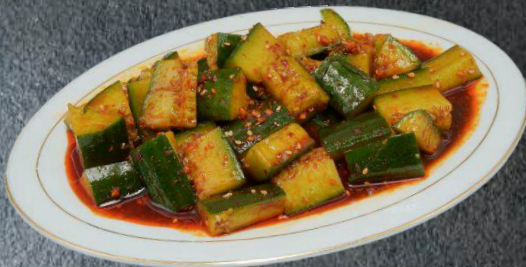
3. Terhemek 5,99 mit geschnittenen Gurken und pikant gewürzter Uigursoße (N)