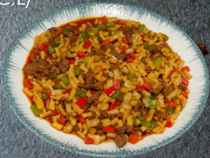
34. Marjan-Kormasi 14,99 im Wok gebratene Perlen- Nudel, Rindfleisch, Zwiebeln, rote und grüne Paprika (A,C,N)