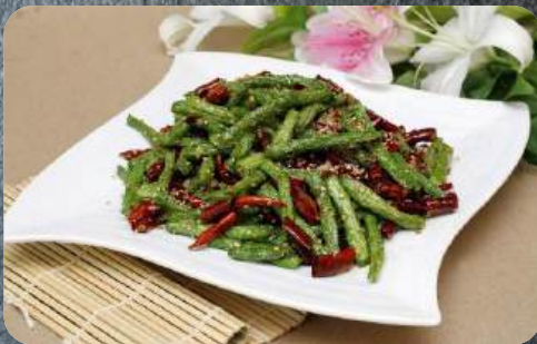
64. Yis Purcak Kormasi 15,99 Rote Paprika, grüne Bohnen. Beilage Reis