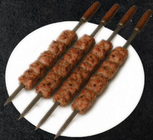
21. Uigur Kawap 22,99 Lammfleisch, Zwiebeln, Gewürze. 5 Stück