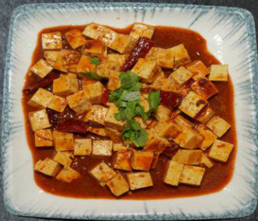
62. Accik Tofu Kormasi 15,99 Tofu, Chili. Beilage Reis