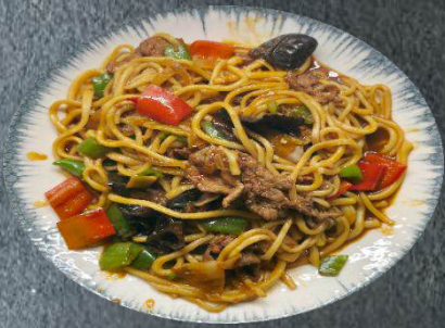
30. IZ-Spezial-Laghmen 15,99 gekochte Nudeln, mehr Rindfleisch, Zwiebeln, rote und grüne Paprika, Schwarze Pilze. (A,C,L)