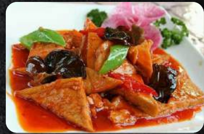
63. Tofu Kormasi 15,99 rote und grüne Paprika, Tofu. Beilage Reis